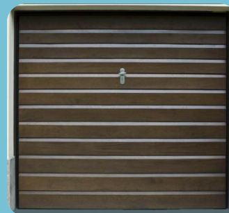
Porte de Garage

Siege social: Marcory Anoumabo - 11 BP 2608 Abidjan 11 – Tél: 21 56 61 51/ 09 85 38 30/ 49 57 90 42 RCC N CI-ABJ-2013-A-13690 - CC N 1343419 E